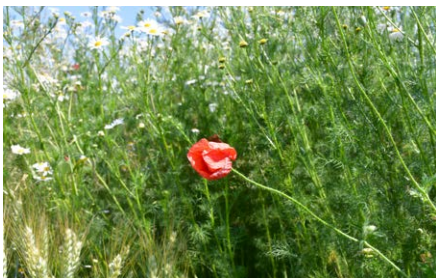
Szintén fontos és gyakori gyomnövény a pipacs ( Papaver rhoeas )