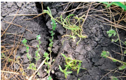
Quelex™ két hetes hatás galajon Besenyszög 2020. április 29.