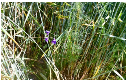
A búzatáblák egyik leggyakoribb gyomnövénye a szarkaláb ( Consolida spp. )