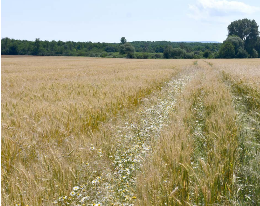
Balra Quelex™, jobbra ebszékfűvel erősen fertőzött terület Zalamegyes 2020 tavasz

A Quelex a Corteva legkorszerűbb granulátum gyártási eljárásával készül. Az úgynevezett GoDRI™ formulációnak köszönhetően gyorsan diszpergálódik még hideg (<5°C) vízben is. Kijuttatás közben nincs ülepedés és nem dugulnak el a szórófejek, aminek köszönhetően egyenletesebb permetlé fedettséget érhetünk el. A magasabb hatóanyag koncentrációt lehetővé tevő formuláció alacsonyabb kijuttatási dózist, ezáltal alacsonyabb terhelést jelent a környezet számára.