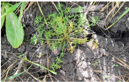
Quelex™ két hetes hatás ebszékfűvön Besenyszög 2020. április 29.