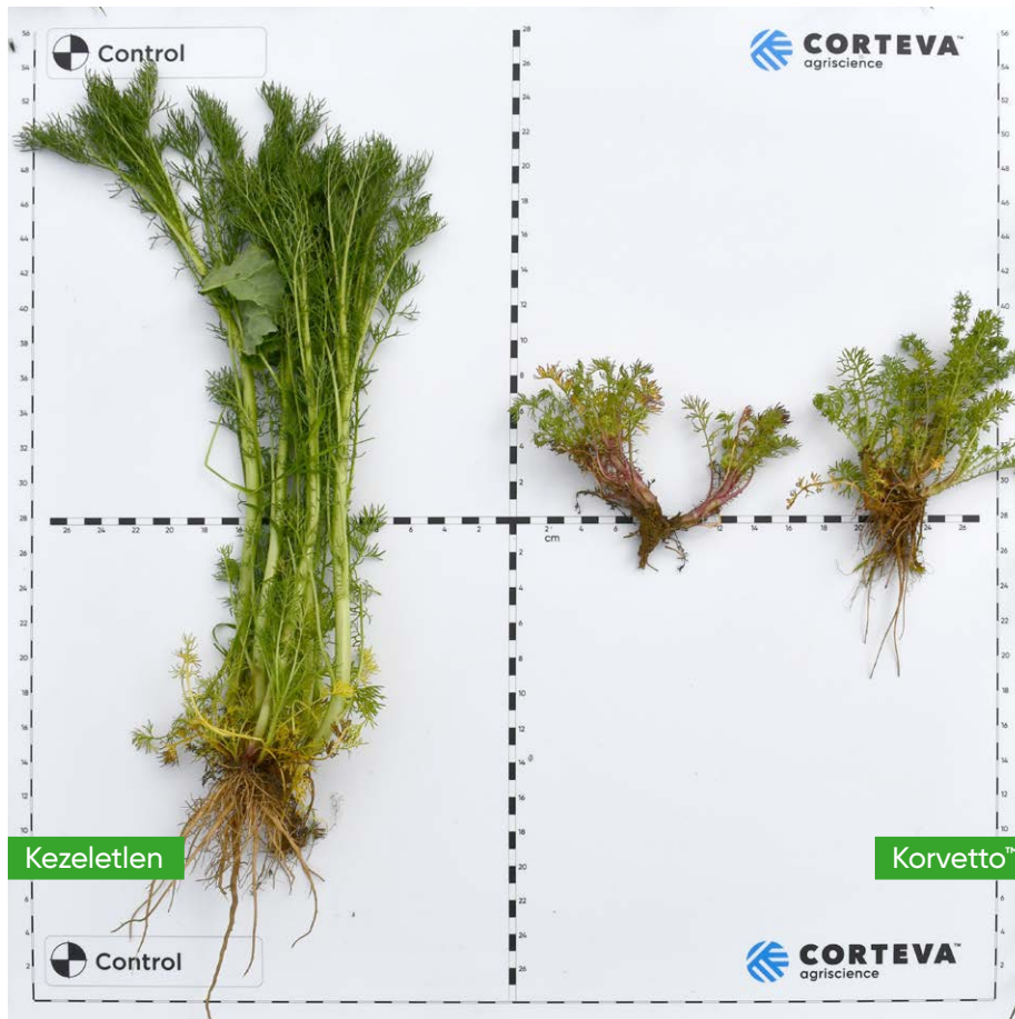
Korvetto™ hatékonysága ebszékfű ellen. Rábahidvég