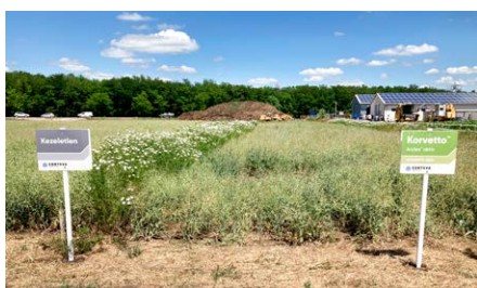
Korvetto®-val kezelt parcella, mellette kezeletlen. Látókép

Normál vetésváltás esetén a készítmény kijuttatását követő év tavaszán nincs utóvetemény korlátozás.