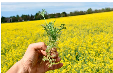
Korvetto® hatása sebforrasztó zsomboron. Balatonszemes