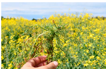
Korvetto® hatása ebszékfűvön. Balatonszemes

A készítményben lévő mindkét hatóanyag szisztémikus, felszívódó hatású. Az Arylex™ (halauxifen-metil) az auxin hatású piridin-karboxilátok közé tartozó új hatóanyag (HRAC 4. herbicid csoport) . A klopíralid szintén hormonszerű tüneteket okoz, de egy másik csoportba, a piridil-karboxilsavak közé tartozik (O herbicid-csoport). Hatásukra az érzékeny gyomok csavarodnak, torzulnak és fokozatosan sárgulnak, majd aztán 2-3 héten belül (a hőmérséklet és az időjárás függvényében) elpusztulnak. A hatóanyagok tartamhatással nem rendelkeznek és nem perzisztensek.