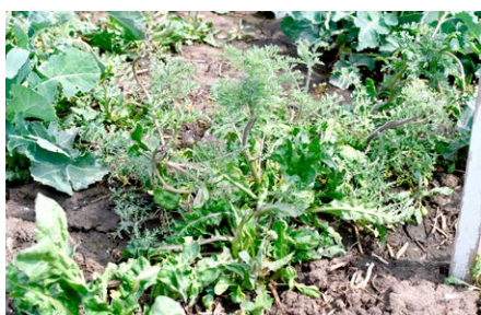
Korvetto® hatása sebforrasztó zsomboron. Látókép

Új hatóanyagtartalmú, széles hatásspektrumú gyomirtó szer a repce legfontosabb tavaszi gyomnövényei ellen.